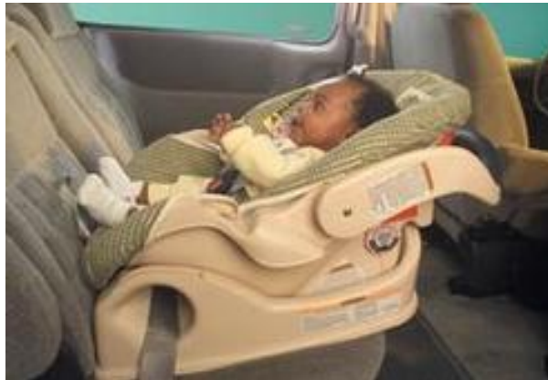
Κάθισμα που βλέπει προς τα πίσω

Ο κίνδυνος σοβαρού τραυματισμού σε παιδιά 0-4 ετών σε κάθισμα που βλέπει μπροστά είναι 40% σε σχέση με το κάθισμα που βλέπει προς τα πίσω που είναι μόνο 8% δηλαδή το κάθισμα που βλέπει προς τα πίσω είναι 5 φορές πιο ασφαλές από ένα κάθισμα που βλέπει προς τα εμπρός.