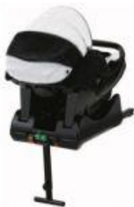
Σύστημα ISOfix που βλέπει προς τα πίσω

Γίνονται ενέργειες όπως το σύστημα εφαρμοστεί για όλες τις ηλικίες.