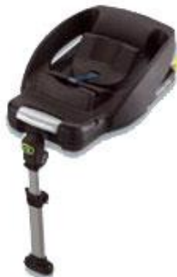
Ανυψωτικό σύστημα ISOfix